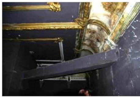
Imagen 103. Conductos, bandejas obsoletos en cabina