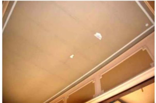
Imagen 130. Detalle