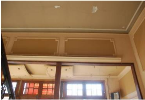
Imagen 129. Cielorraso aplicado de foyer