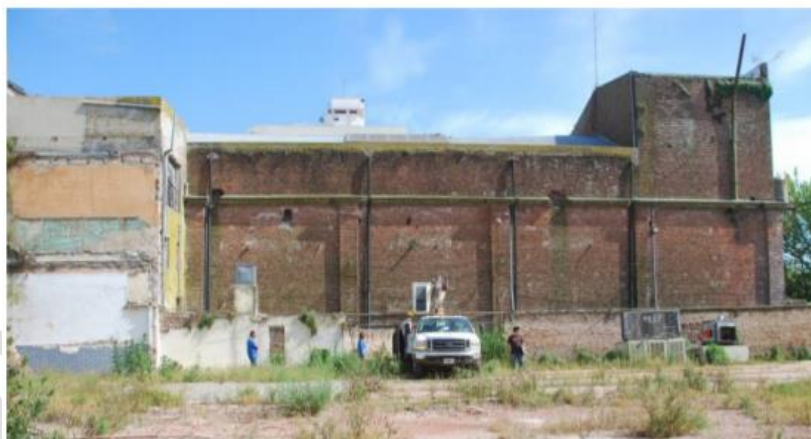
Imagen 13. Fachada lateral hacia servidumbre de paso.

La caja muraria de ladrillo a la vista presenta fisuras y problemas de erosión de las juntas. Se recomienda una limpieza de toda la superficie con vapor a baja presión, el retiro de material suelto en las juntas, el cepillado con cerdas suaves de la superficie para posteriormente proceder a la reposición de material faltante con morteros compatibles que garantice continuidad (tomado de juntas), se recomienda un especial cuidado en las fisuras que deberán consolidarse (Imágenes 14 a 17). Es necesario realizar una cuidadosa limpieza de los restos de morteros de las juntas para lograr homogeneidad y conservar su textura y color. Deberán tomarse muestras y realizar ensayos de laboratorio para encontrar las proporciones adecuadas para la realización de morteros. Una vez saneado el soporte y reconstituidas las juntas, se aplicarán pinturas para protectoras, tales como consolidantes o hidrolaqueados que le brinden protección a la superficie.