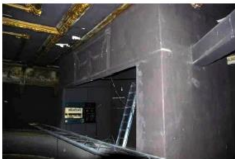
Imagen 102. Cabina existente