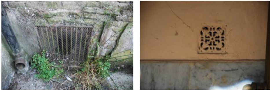
Imágenes 67 y 68. Rejas existentes a restaurar.