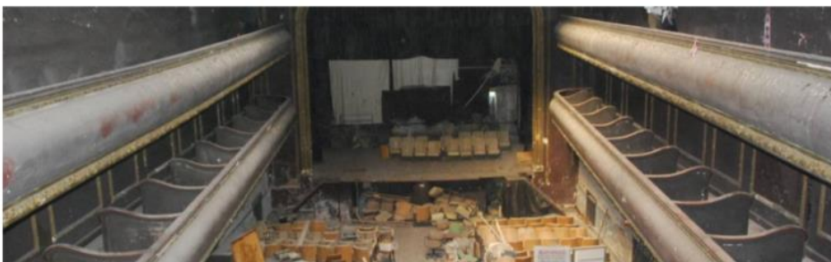
Imagen 18. Tabiques divisorios de palcos

Los palcos laterales, resueltos en dos niveles, incluyen unos separadores de madera que los definen en el primer nivel, careciendo de los mismos el nivel superior. Se preservarán y restaurarán previa consolidación estructural definida en el ítem entrepisos (Imagen 18).