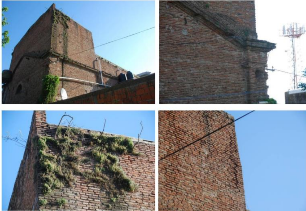
Imágenes 14, 15, 16 y 17. Estado actual de la mampostería de caja muraria