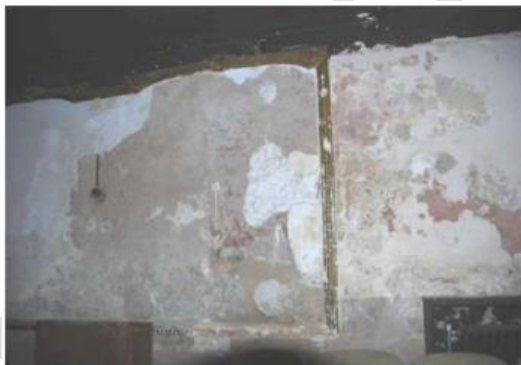
Imagen 19. Estado de revoques interiores en planta baja